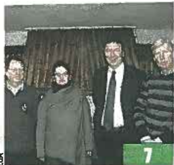
Aiseau Presles La nouvelle équipe du cdH