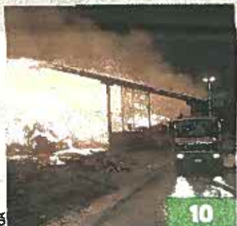
Brye Nouvel incendie dans un hangar